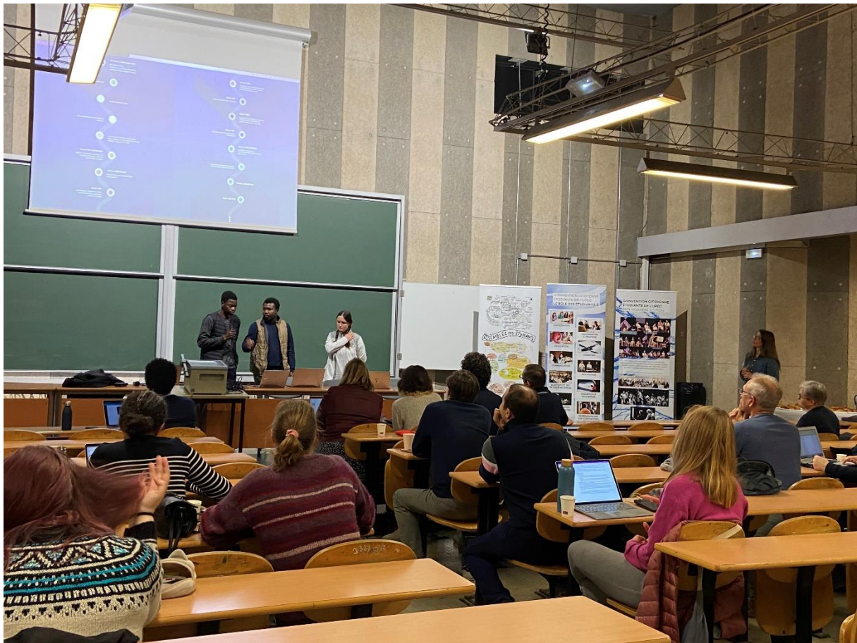
Contribution des étudiant.e.s du parcours EIPI aux travaux de la Convention Citoyenne Etudiante (CCE) de l'UPEC (décembre 2023).