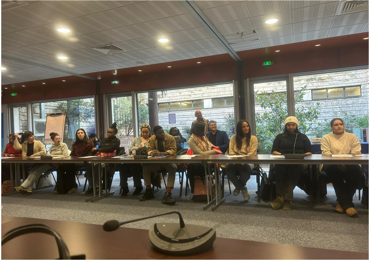
Présentation de projets internationaux portés par l'IIEP - Unesco.