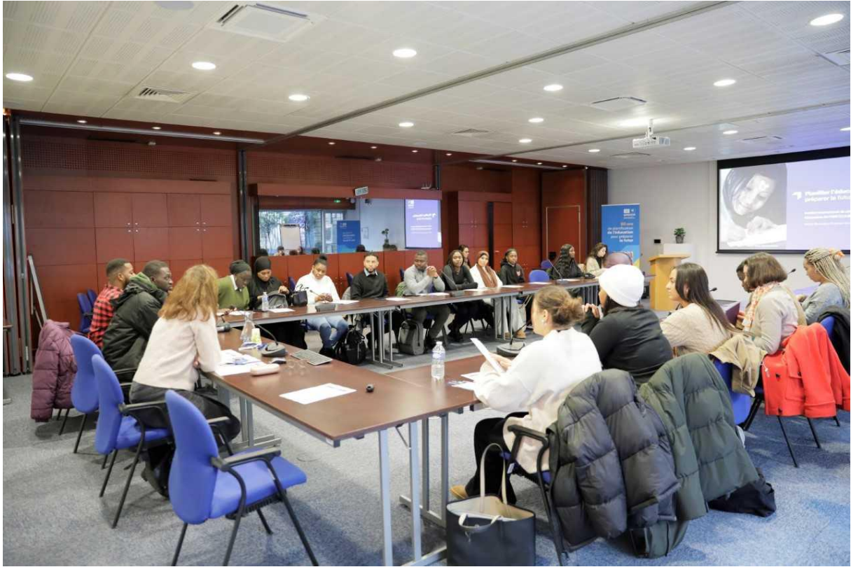
Rencontres, échanges et séances de travail à l'Institut International de Planification de l'Unesco (IIEP).