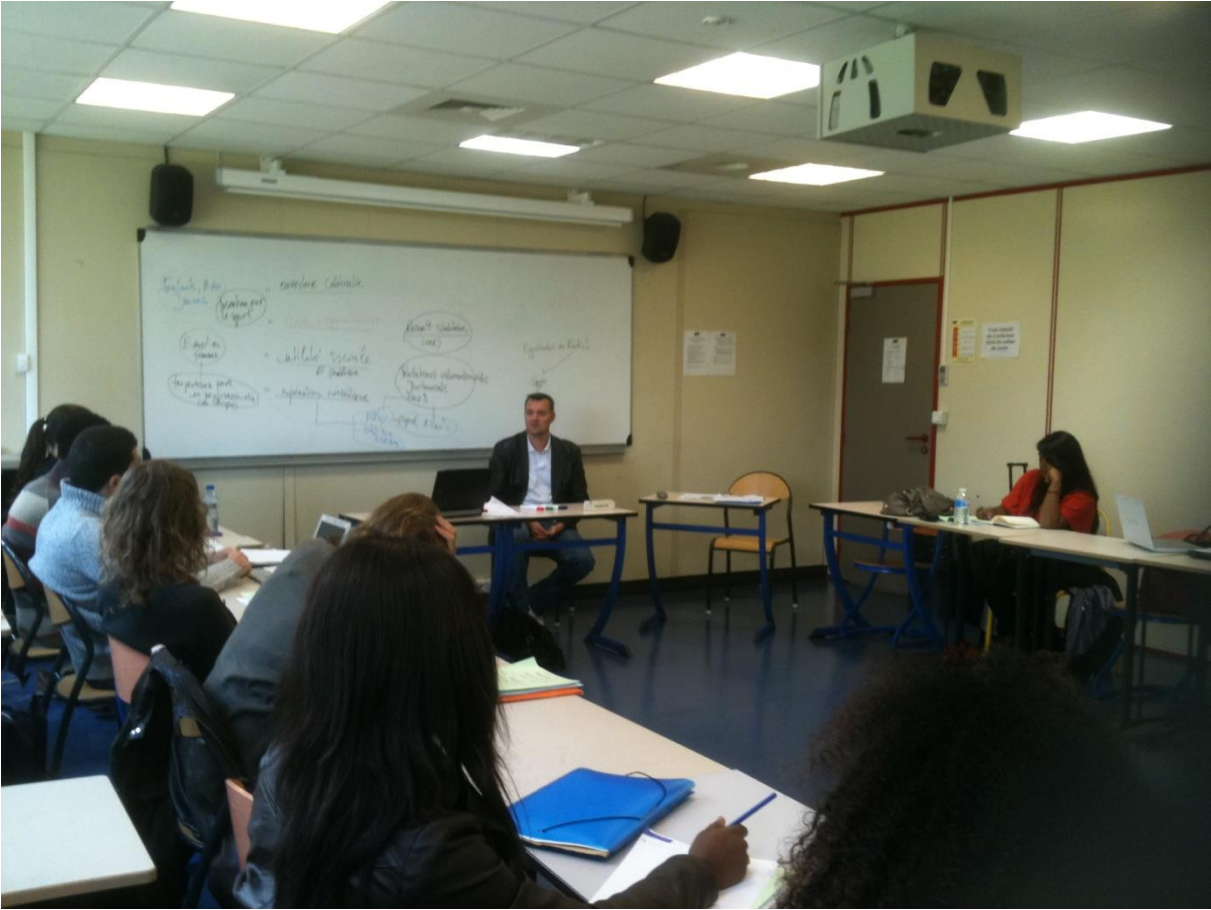
Une dynamique de projet...